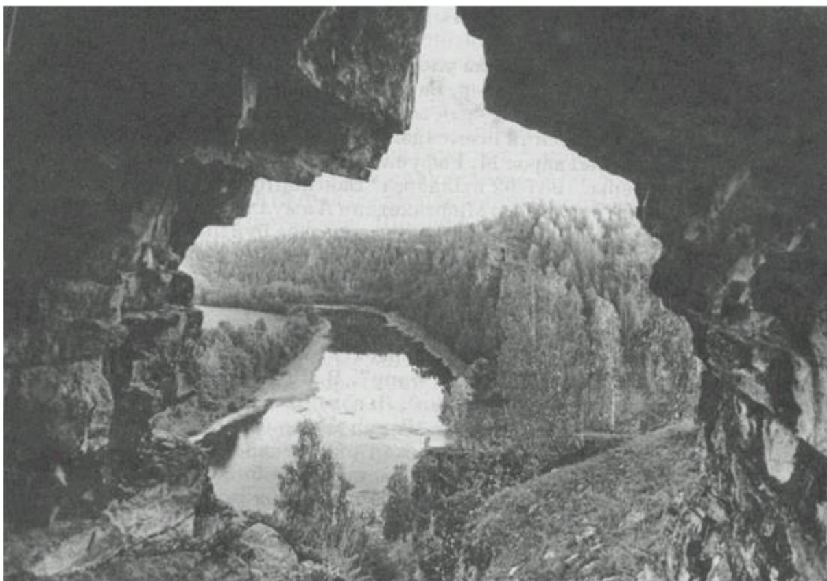
Пещера Салавата Юлаева

Пещера Салавата Юлаева расположена на правом берегу реки Юрюзань, в четырех километрах от села Малояз. По народным преданиям, в период царских репрессий, после поражения крестьянского восстания под руководством Е. Пугачева, в пещере скрывался Салават Юлаев, что нашло отражение в названии пещеры. Описанию этому памятнику истории и природы нашего края и посвящена небольшая публикация на страницах журнала «Ватандаш».